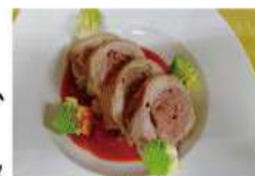
鶏肉のガランティーマ

※大変申し訳ございませんが、新型コロナウイルス感染症対策のため、今年度は託児はありません。