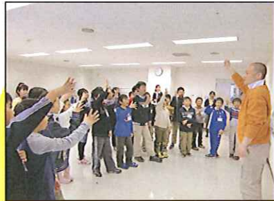
子ども体験隊・開講式でゲームをしました(5月23日)

当センターでは、今年度も子どもから中 年にいたるまでの各世代に応じた各種講座 を多数実施してきました。 ここでは7月までに開催した講座を写真 でご紹介します。