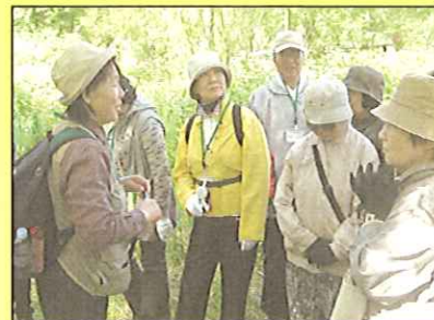
いきがい新発見・ノロック号で温泉探検(6月18日)