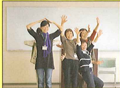
いきいき女性講座・表現で互いを知り合おう(5月29日)