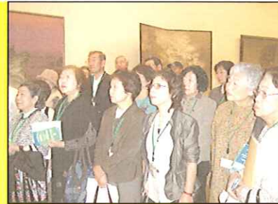
いきがい新発見・日本画展鑑賞(5月28日)