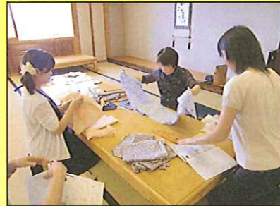
すこやか子育て講座・子どものゆかたづくり(6月2日)