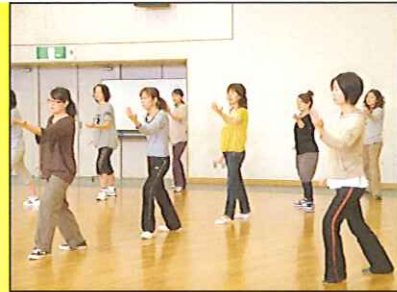
すこやか子育て講座・太極拳に挑戦!(5月26日)