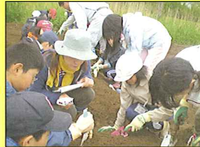
子ども体験隊・じゃがいもを植えました(6月6日)