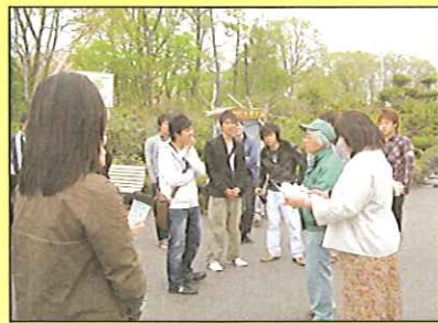
大学生の釧路講座・釧路市内を見学しました(6月10日)