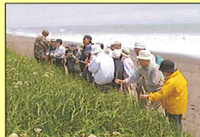
釧路学教養講座・十勝地方の自然と歴史(7月4日)