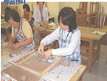
いきいき女性 (5月~9月・13回) 受付 5月2日~ (35名募集)