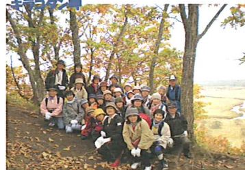
釧路学 (6月~2月・15回) 受付 6月4日 (35名募集)