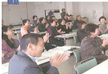
生きがい新発見 (5月~10月・15回) 受付 4月9日~ (35名募集)