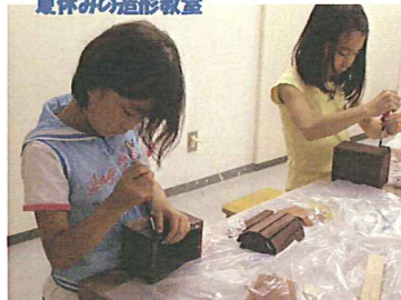
子どもチャレンジ (7月~1月) 受付 各講座ごとに異なります。