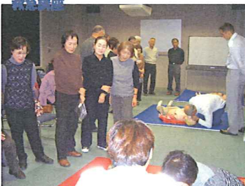
学んでボランティア (11月~12月・6回) 受付 10月7日~ (30名募集)