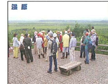
ふるさと講座 (5月~2月) 受付 各講座ごとに異なります。