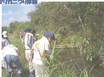
まなぼっと子ども体験隊 (5月~2月・17回) 受付 5月2日~16日 (30名募集)