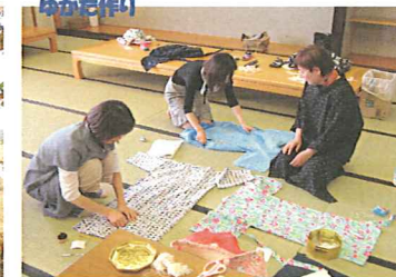
すこやか子育て (5月~3月・8回) 受付 各講座ごとに異なります。