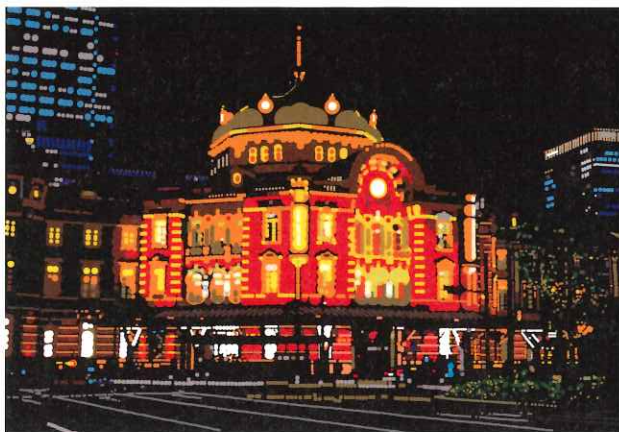
《Plastic Love (釧路駅)》 ©Yukino Ohmura